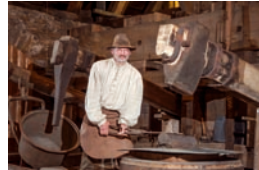
Führung im Kupferhammer

Nutzen Sie den monatlichen Veranstaltungskalender aus den Tourist-Informationen in Seiffen und Olbernhau! Alle Veranstaltungen und Ausstellungen auch auf www.olbernhau.de