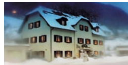
Haus der Begegnung Rothenthal