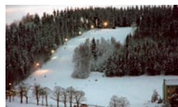
Skihang am Hainberg