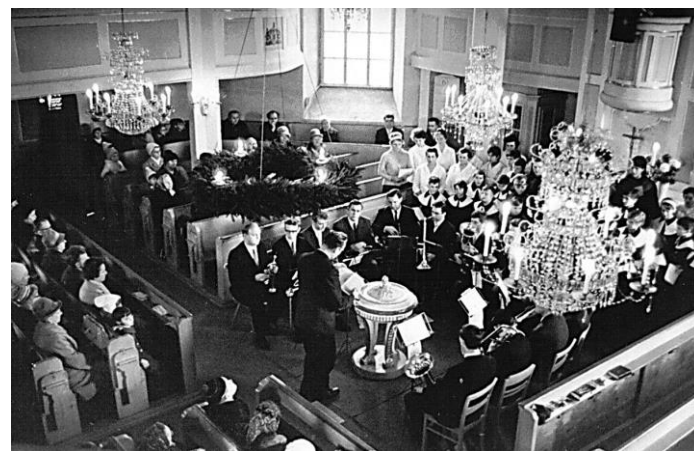
Adventsmusik in den 60er Jahren

Die Fremden eilen in der Kälte dieses ersten Adventssonntags, zum nahen Kirchlein, sie stehen dicht und drängen sich vorm Eingang, mit Schachteln aller Art