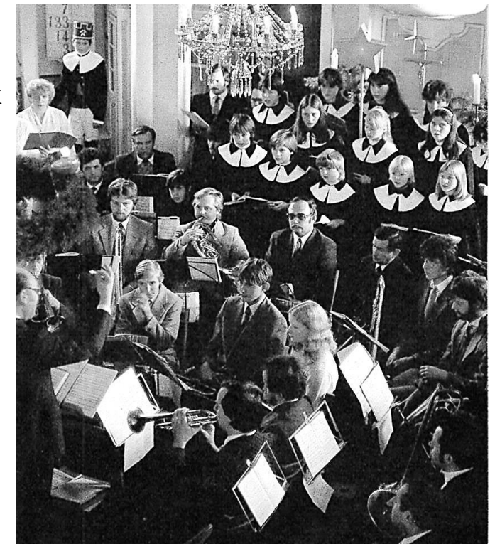
Adventsmusik in den 80er Jahren

Unter den Klängen der Orgel, die vom sich drehenden Zimbelstern begleitet werden, verlassen wir erfüllt mit Mahnung und Trost das Kirchlein.