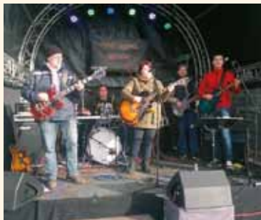
Every Second Saturday