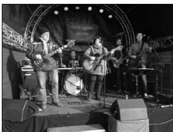
• 07.12.19 • Every Second Saturday