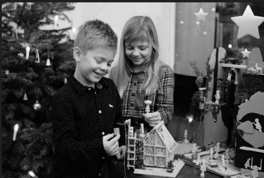
Und der Weihnachtsmann wartet nebenan in seiner Werkstatt auf alle kleinen und großen Besucher!

Erzgebirgisches Holzspielzeug zum Ausprobieren + Bastelzügen + Souvenir-Werkstatt und mehr!