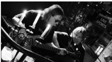
• 30.11.19 • Tramp Station

Hauptstr. 72 – gegenuber Spielzeugmuseum jeden Adventssamstag 18:30 – 21:30 Uhr Eintritt frei!