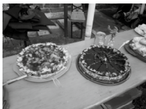
Veranstaltung im EU-Großprojekt: „Gemeinsame Geschichte und Traditionen im Erzgebirge aktiv erleben“