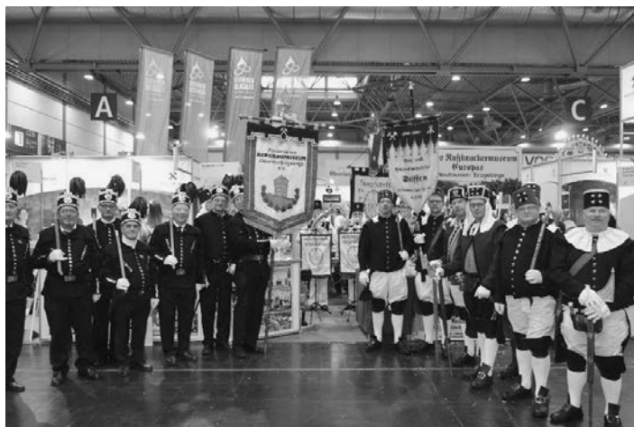
Bereits im vergangenen Jahr (2018) haben Berg- und Huttenleute fur die Montanregion Erzgebirge/Krunohoi auf der T&C in Leipzig geworben.