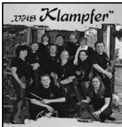
• 14.12.19 VHS-Klumpfer