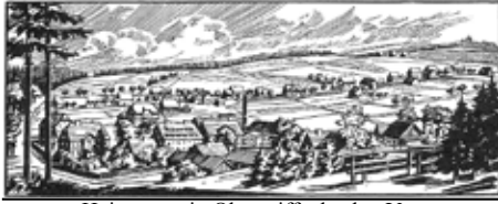
Heimatverein Oberseiffenbach e.V.