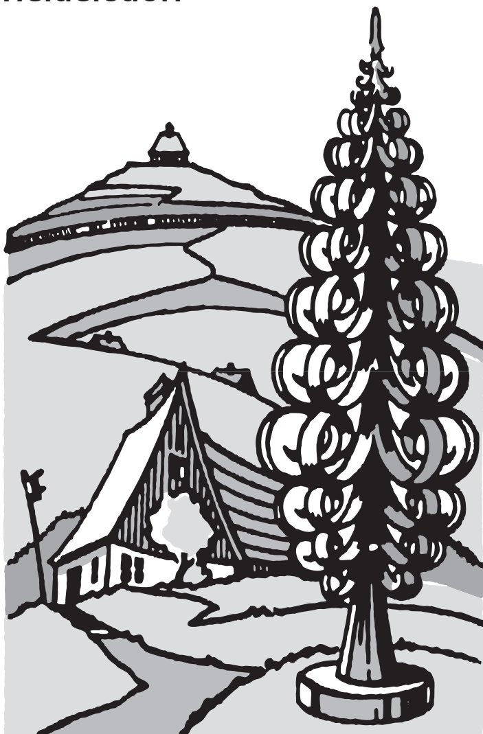
Grafik: Hans Reichelt

Ausgabe September 2024 Erscheinungstag 30.08.2024