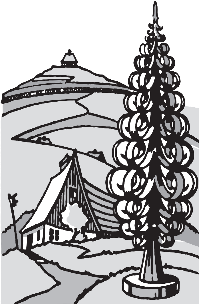
Grafik: Hans Reichelt

Ausgabe November 2024 Erscheinungstag 30.10.2024